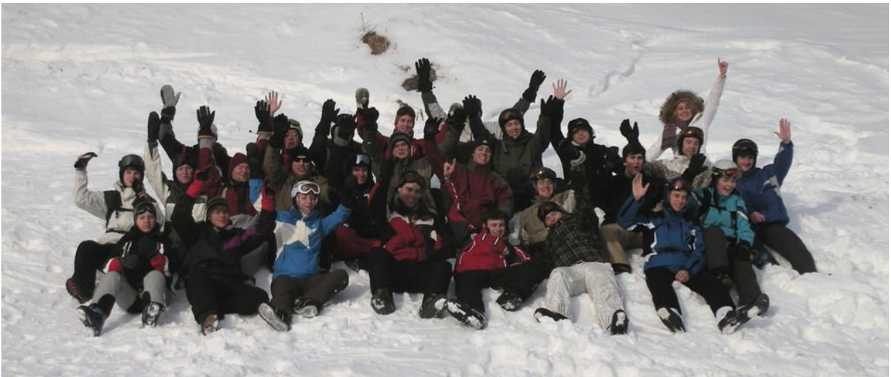
Kuva5. Koko Estiem-porukka toisena päivänä lähdössä rinteeseen.

Matkan aikana pääsimme tutustumaan toisiin estiemiläisiin, paikallisiin herkkuihin, afterskihin, loistaviin rinteisiin ja nauttimaan raittiista alppi-ilmasta. Kokonaisuutena tapahtumasta jäi meille varsin positiivinen mieli ja suosittelemme muitakin osallistumaan kyseiselle Activity Weekille tulevaisuudessa, mikäli se järjestetään.